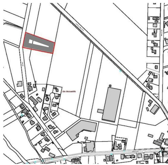
TG2 - Weertzen